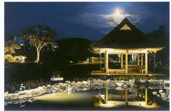
라이트 업 된 정원구역

넓은 잔디 광장에는 잔존물이 평면 표시되어 있으며, 토루 전시실에서는 토루 안에 들어가서 축조 방법을 견학 할 수 있습니다.